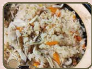
〈おすすめ土鍋〉 かまどさん

かまどさんは、火加減いらずで、かまど炊き のようなふっくら美味しいご飯が炊き 上がります。保温力も抜群です。