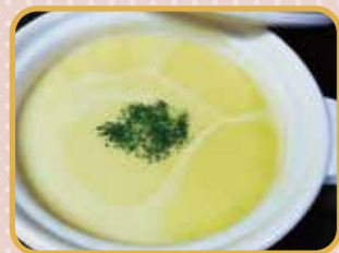
〈おすすめ土鍋〉 ピストロ土鍋

ピストロ土鍋は、炒めもの・煮込み・蒸し 焼・オープン料理など、いろいろなメニュー が作れる万能でおしゃれな土鍋です。